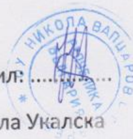
ГРАФИК за контролни работи за I срок на първи клас през учебната 2022/2023 година